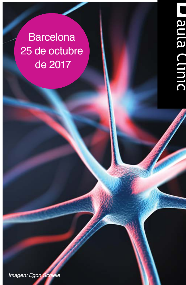
Imagen: Egon Schiele