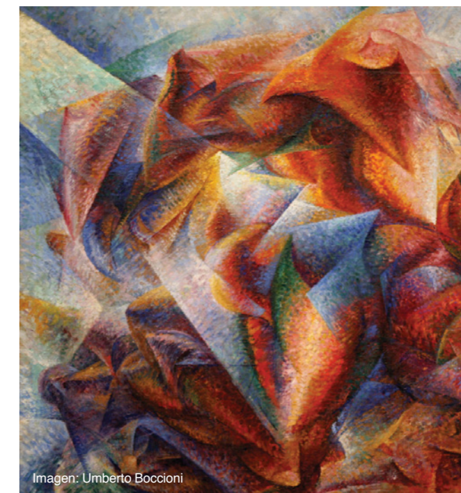
Imagen: Umberto Boccioni